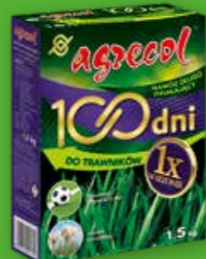
100 DNI DO TRAWNIKÓW I TRAW OZDOBNYCH - nawóz długo działający