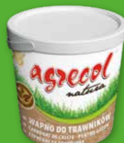
WAPNO DO TRAWNIKÓW - nawóz wapniowy