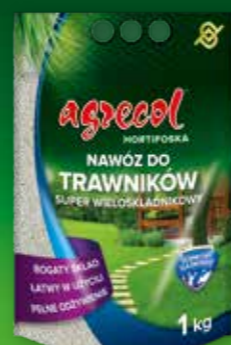
HORTIFOSKA nawóz do trawników

agrecol Inne przydatne w uprawie trawników produkty AGRECOL