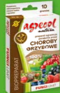
Fungi-LIMIT - preparat ogranicza porażenie przez choroby grzybowe