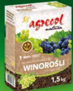
Organiczny nawóz do winorośli

Inne przydatne w uprawie produkty AGRECOL