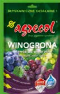
WINOGRONA - nawóz krystaliczny do winogron