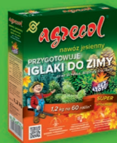
NAWÓZ JESIENNY - przygotowuje do zimy iglaki