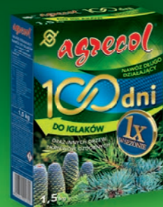
100 DNI - nawóz do iglaków

Inne przydatne w uprawach produkty AGRECOL