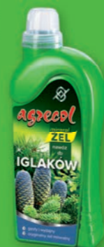
MINERAL ŻEL - nawóz do iglaków